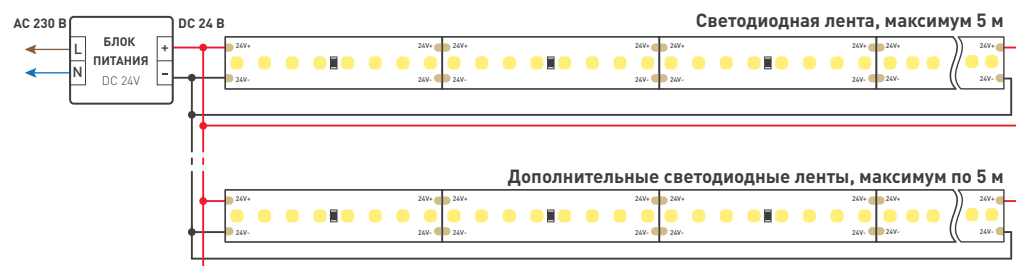
Схема 1. Подключение нескольких светодиодных лент с двух сторон